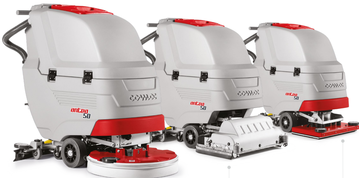
ANTEA 50 E/B/BT Versione lavante con spazzola a disco