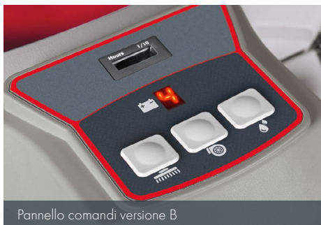
Pannello comandi versione B