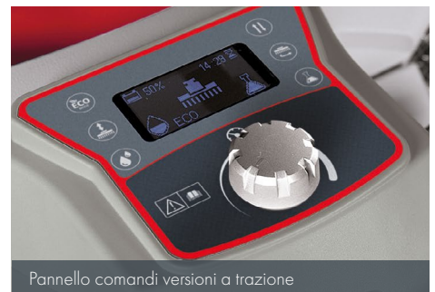
Pannello comandi versioni a trazione

Le versioni senza trazione (Antea 50 E/B) sono dotate di un pannello comandi essenziale che favorisce un utilizzo immediato.