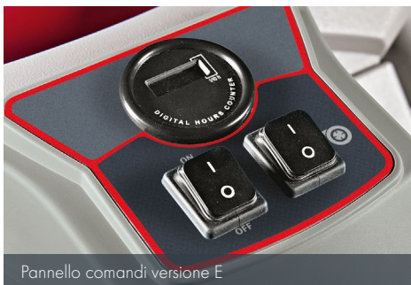
Pannello comandi versione E